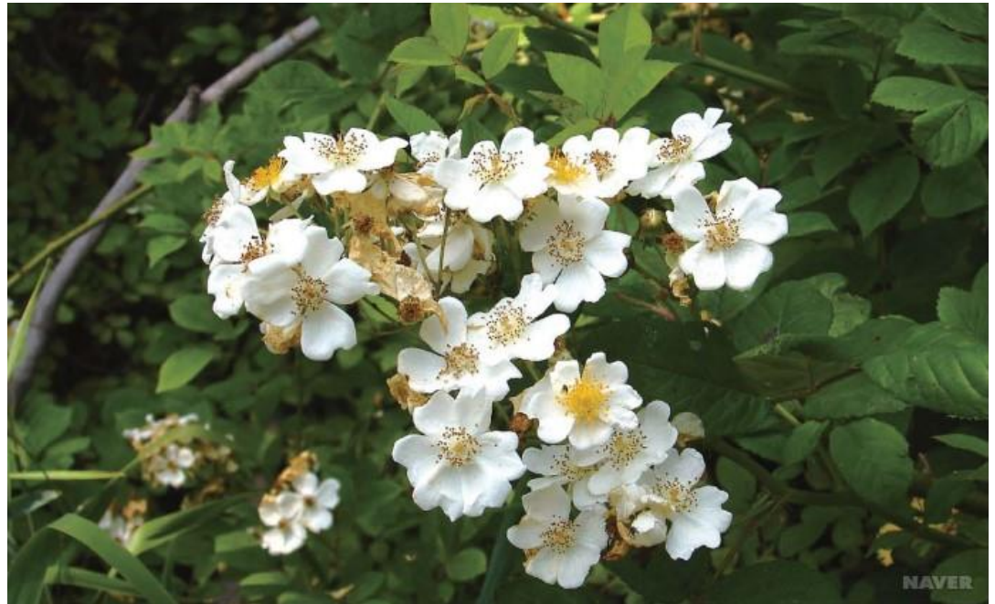
찔레나무 꽃